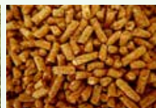
Lettiere vegetali di piccoli animali non carnivori