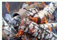
Cenere di legno (non di carbone)