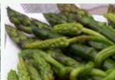
Scarti organici di cucina vegetali cotti