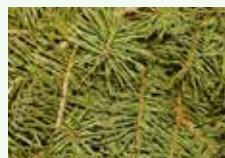
Foglie resistenti alla decomposizione: magnolia, aghi di conifere, castagno, ecc.