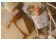
Croste di formaggio