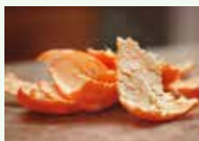
Bucce di agrumi non trattati e smiuzzate